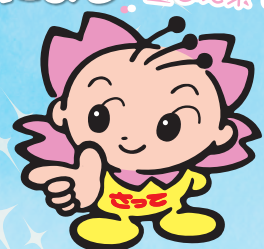
幸手市のマスコット さっちゃん